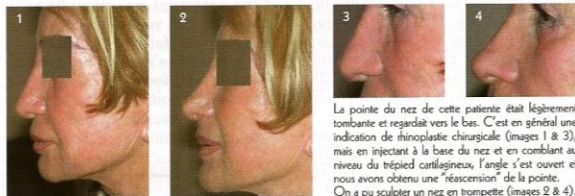
La pointe du nez de cette patiente était légèrement tombante et regardait vers le bas. C'est en général une indication de rhinoplastie chirurgicale (images 1 & 3), mais en injectant à la base du nez et en comblant au niveau du trépid cartilagineux, l'angle s'est ouvert et nous avons obtenu une "résurrection" de la pointe. On a pu sculpter un nez en trompette (images 2 & 4).

Nez tordu, trop large, trop long, ou simple petite imperfection, la rhinoplastie est très certainement l'une des opérations vedettes de la chirurgie esthétique. Plus que toute autre intervention, le résultat doit être sans reproche, tant il se voit... comme le nez au milieu de la figure ! Pourtant, avant d'envisager une telle opération, il y a des petits défauts qui peuvent se régler sans passer par le bistouri !