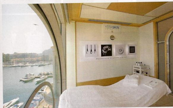
La cabine Kéraskin Esthetics aux Thermes Marins de Monte-Carlo