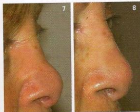
Ici, c'est le résultat de différentes interventions qui n'avaient pas satisfait la patiente. Elle ne souhaitait pas retenter une opération, aussi le comblement au niveau de la ligne médiane a réussi à lui redonner un nez de belle allure.

Lidocaïne (sans conservateur) est souvent ajoutée afin d'optimiser le confort quand le gel est injecté dans le derme. Mais certains laboratoires spécialisés ont mis au point différents produits de comblement qui contiennent des anesthésiques intégrés, comme la Gamme Juvéderm® ULTRA, produit parfaitement adapté à ce genre d'intervention, non allergène et sans effets secondaires.